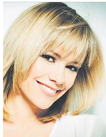
Mit dabei: Hansi Hinterseer und Francine Jordi.

DER musikalische Saisonauftakt! Ein Musikfest in den Bergen – in Zell/See, an einem der schönsten Plätze Österreichs. Malerisch gelegen zwischen See und Schmittenhöhe tummeln sich die Stars der Volks- und Schlagermusik – ein unvergleichliches Erlebnis für alle Fans. Alle Musikveranstaltungen finden in der exklusiv dekorierten Eishalle von Zell am See statt.